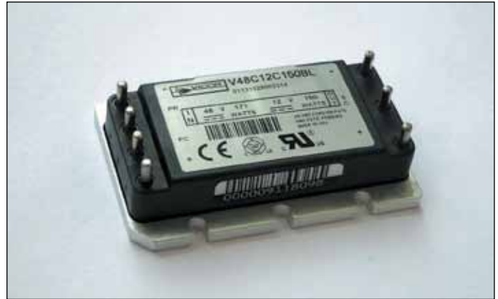
Рис. 3. Модуль Vicor семейства Micro

и частотой от 47 до 63 Гц или от резервной аккумуляторной батареи с номинальным напряжением 24 В. Выходы преобразователей M1 и M2 подключаются к общей промежуточной шине соответственно через диоды D1 и D2, благодаря чему система автоматически переходит на питание от резервного источника при отключении от сети переменного тока. В зависимости от требуемого рабочего температурного диапазона в качестве входного AC/DC-преобразователя используется один из модулей Vicor семейства VI Brick AC Front End (рис. 2): FE175D480C033FP-00, FE175D480T033FP-00 или FE175D480M033FP-00. Минимальная температура эксплуатации этих модулей равна -20, -40 и -55 °С соответственно. Что же касается максимальной рабочей температуры металлического основания модуля, то она не зависит от его температурного класса и равна +100 °С.